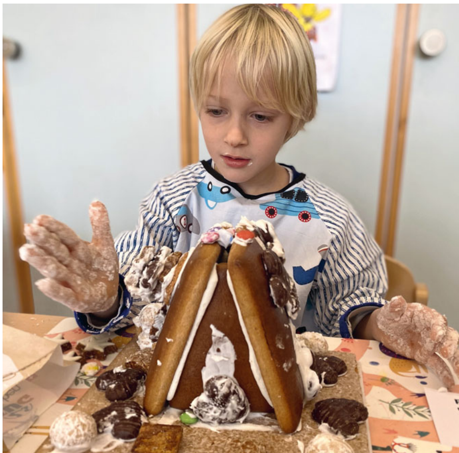
Dank Zuckerguss klebt alles am gewünschten Ort.

Herzlichen Dank für die Chnuserhäuschen: Wir haben das Gestalten und «Schnausen» genossen. (slü)