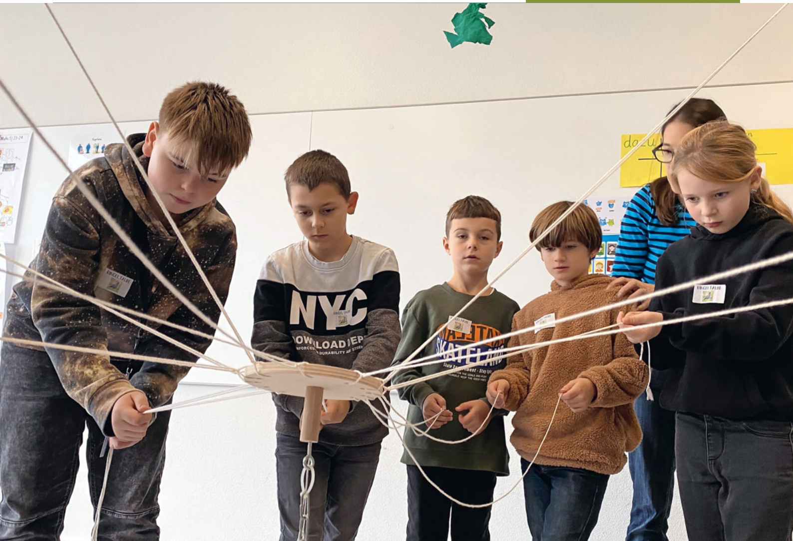
Bei diesem Turmbau sind Konzentration, Feingefühl und Zusammenarbeit gleichermaßen gefragt.