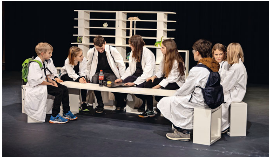
Es wird viel gelacht im Kinder- und Jugendtheater Malters.

Beim Kinder- und Jugendtheater werden nicht nur bekannte Märchen lebendig, auch experimentelle Eigeninszenierungen entführen uns in eine Welt der Träume. Das junge Ensemble schafft es jedes Jahr, die Augen der kleinen und grossen Zuschauer zum Strahlen zu bringen – eine Tradition, die wir auch im kommenden Jahr fortführen möchten! Doch dafür brauchen wir deine Unterstützung, um