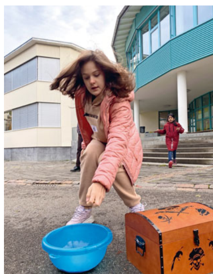
In wenigen Minuten müssen auf dem Pausenhof viele Goldstücke gesammelt werden.

gute Zusammenarbeit wichtig. Um diese zu ermöglichen, waren vor allem die Gruppenführer*innen aus der 6. Klasse