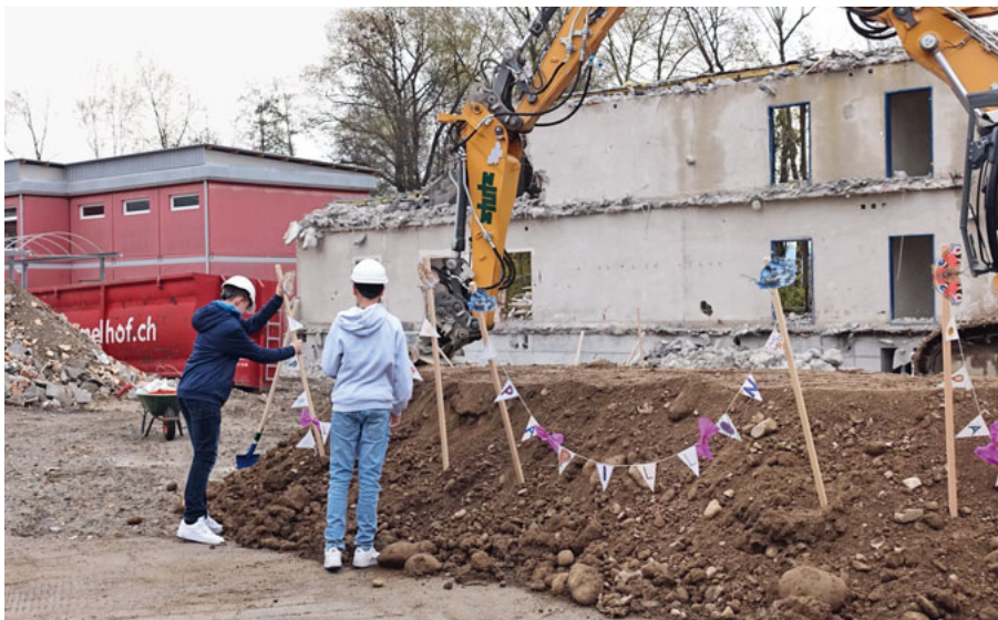
Lernende der 1. Sek platzieren ihre selbstgemachten Wimpel.

forderungen an einen modernen Unterricht nicht mehr. Er stammte aus dem Jahr 1977 und war stark sanierungsbedürftig.