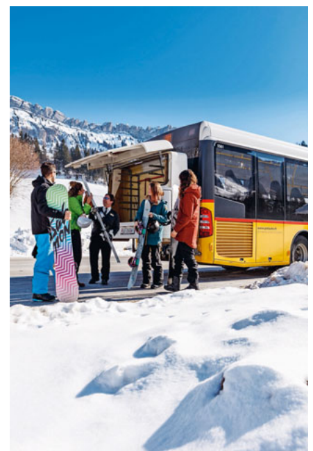
Mit dem öV nach Sörenberg.

zweiten öffentlichen Verbindung nach Sörenberg. (pd)