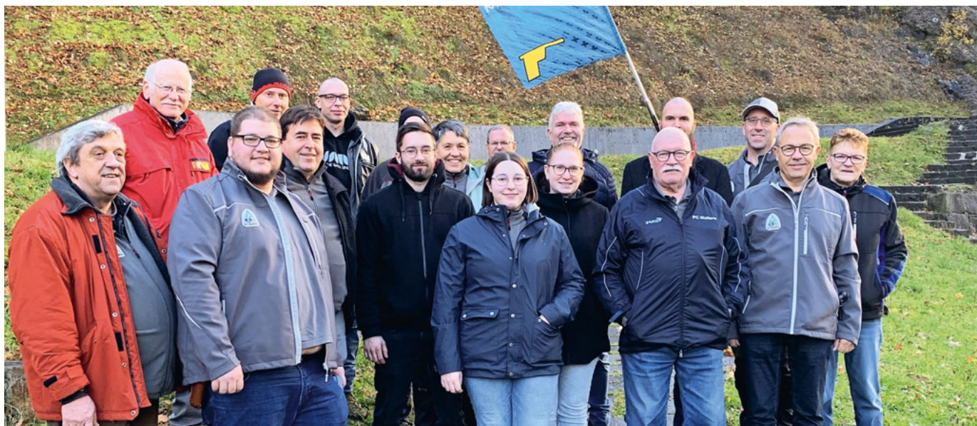
Rang 2 am Morgarten-Schiessen: Pistolensektion Malters.