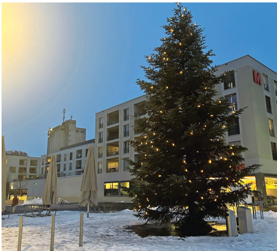
Die Weisstanne aus dem Vogelwald.

Für die Lieferung und das Aufstellen des Baumes waren der Dorfwing und der Werkdienst verantwortlich. Für die Montage und die Beleuchtung war die Steiner Energie AG zuständig. Ihnen allen gebührt ein grosses Dankeschön. (swe)