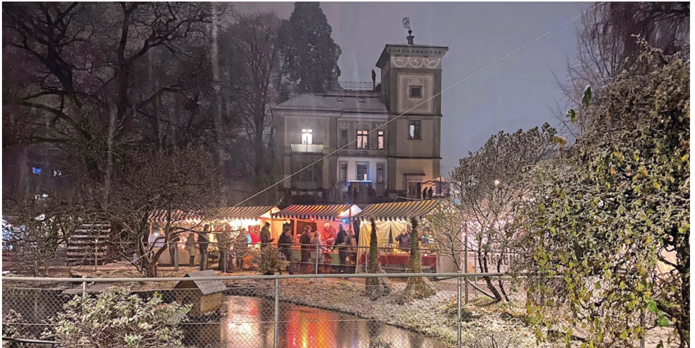
Herrliche Szenerie trotz garstigem Wetter.