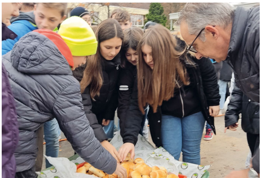
Ein feines Znüni zur Feier des Tages in der Karette serviert.

Der Trakt 3, in dem bis vor Kurzem noch unterrichtet wurde, erfüllte die An-