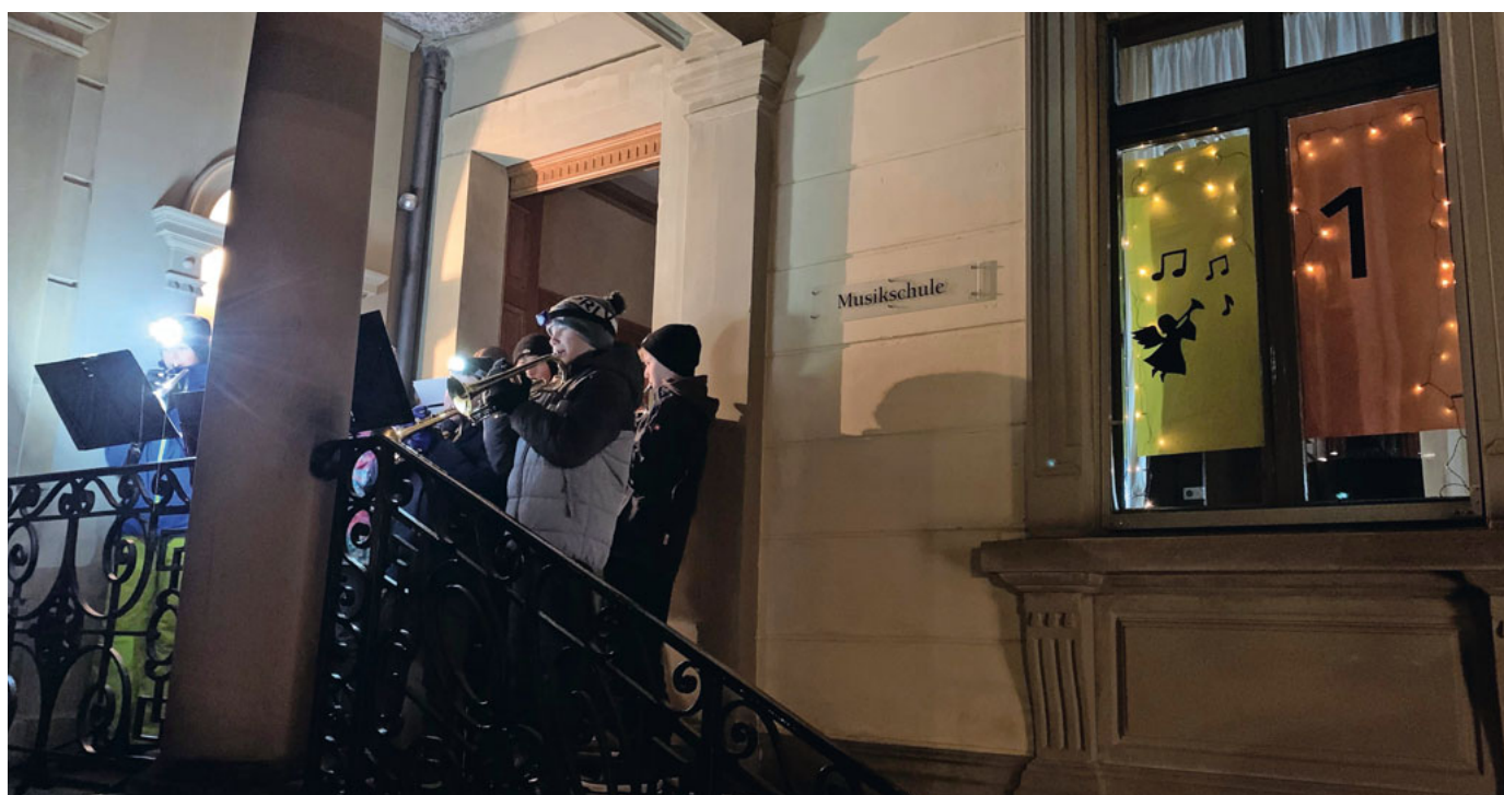
Musikalische Eröffnung des 1. Adventsfensters.

mit einer musikalischen Geschichte in den Advent entführt. (jr)