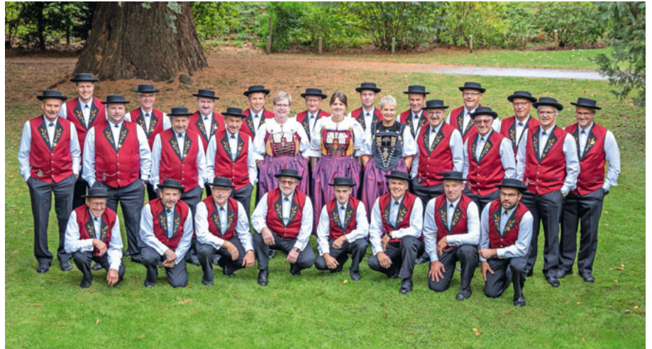
Jodlerklub Blatten

Wer in den Gemeindesaal ans Konzert kommt, der weiss, was ihn oder sie