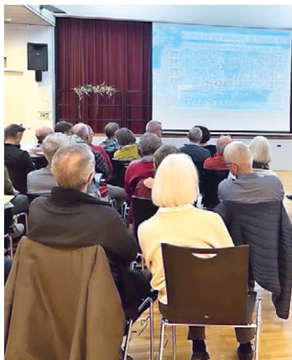
Der Aufmarsch an der GV war gross.

Die Genehmigung der Jahresrechnung und Entlastung des Vorstandes erfolgten einstimmig. Besonders gefreut haben sich die Genossenschafter*innen darüber, dass die Gestaltungsplanänderung angenommen und zum Bauprojekt während der öffentlichen Auflage keine Einsprachen eingegangen sind. Dies wurde mit einem Applaus verdankt. Beim an-