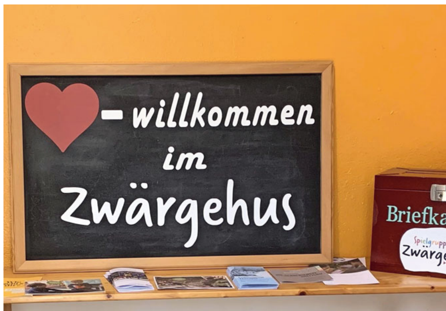
Einblick erhalten in die Spielgruppe Zwärgehus.

An diesen Terminen sind Sie herzlich eingeladen: Samstag, 20. Januar 2024, 9 bis 11.30 Uhr, und Freitag, 26. Januar, 14 bis 17 Uhr. Für den Besuch ist keine Anmeldung erforderlich.