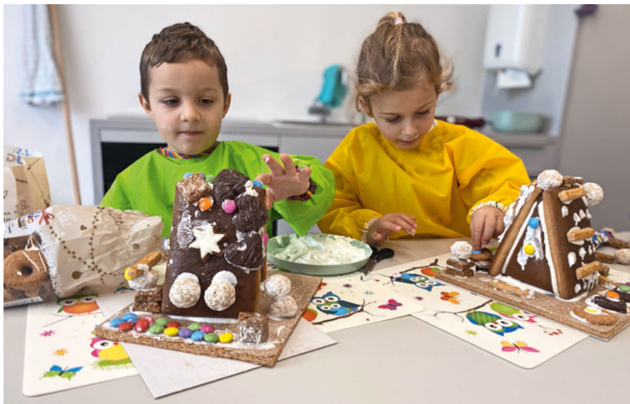
Hochkonzentriert am Verziern.