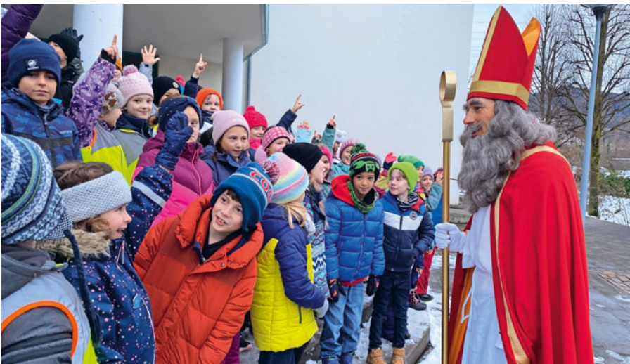
Der Samichlaus besuchte die Schülerinnen und Schüler in Eischachen.

Abgerundet wurde der Nikolausbesuch mit dem vorgetragenen Gedicht der Schüler*innen und einem weiteren Lied. Danach bekamen alle eine feine Mandarine und der Nikolaus machte sich wieder auf, um noch andere Kinder zu besuchen. (Renate Mueller)